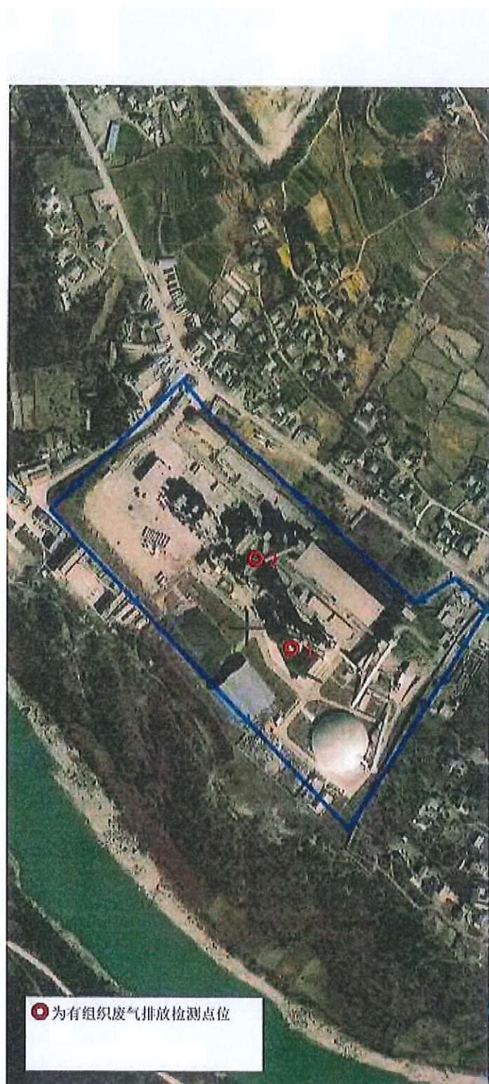
附件 1：检测点位示意图