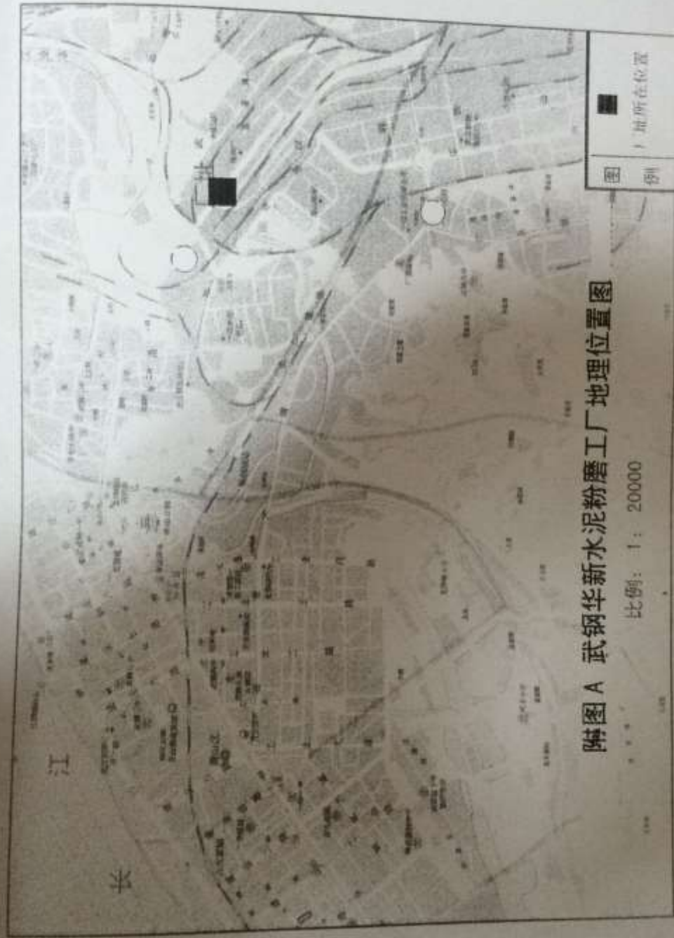
附图 A 武钢华新水泥粉磨工厂地理位置图