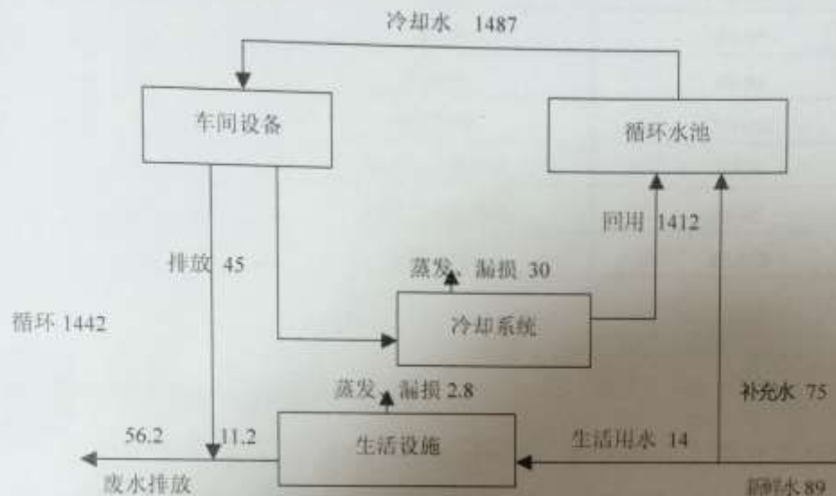
3-2 工程水量平衡图(m 3 /d)